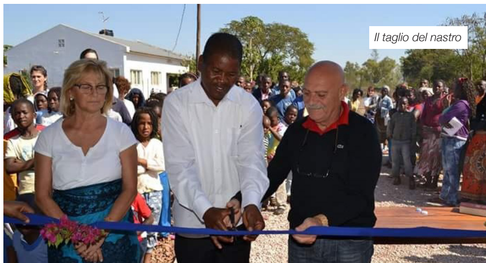
Il taglio del nastro

esperienza indimenticabile e ricca di conoscenza, di averci guidato con la preghiera. Non dimenticherò mai i momenti di preghiera vissuti con gli abitanti del villaggio di Mafuiane, i volti dei bambini, la loro semplicità e dignità. Quando vivi in questi contesti, anche se per poco, ti rendi conto dello spreco, di quanto superfluo abbiamo nel nostro mondo occidentale. Ma ho visto che purtroppo i falchi del capitalismo stanno sempre più prendendo potere, promettendo castello d'oro che non realizzeranno mai, pronti a calpestare il proprio vicino per i loro scopi. Prego Dio che gli amici del Mozambico conoscano le cose buone del mondo occidentale: la scuola, le cure mediche. Spero che non diventino le cavie di uno sviluppo senza confini, e che le risorse del sottosuolo non siano motivo di lotte intestine, finanziate dal nostro mondo, in cui chi paga è la povera gente.