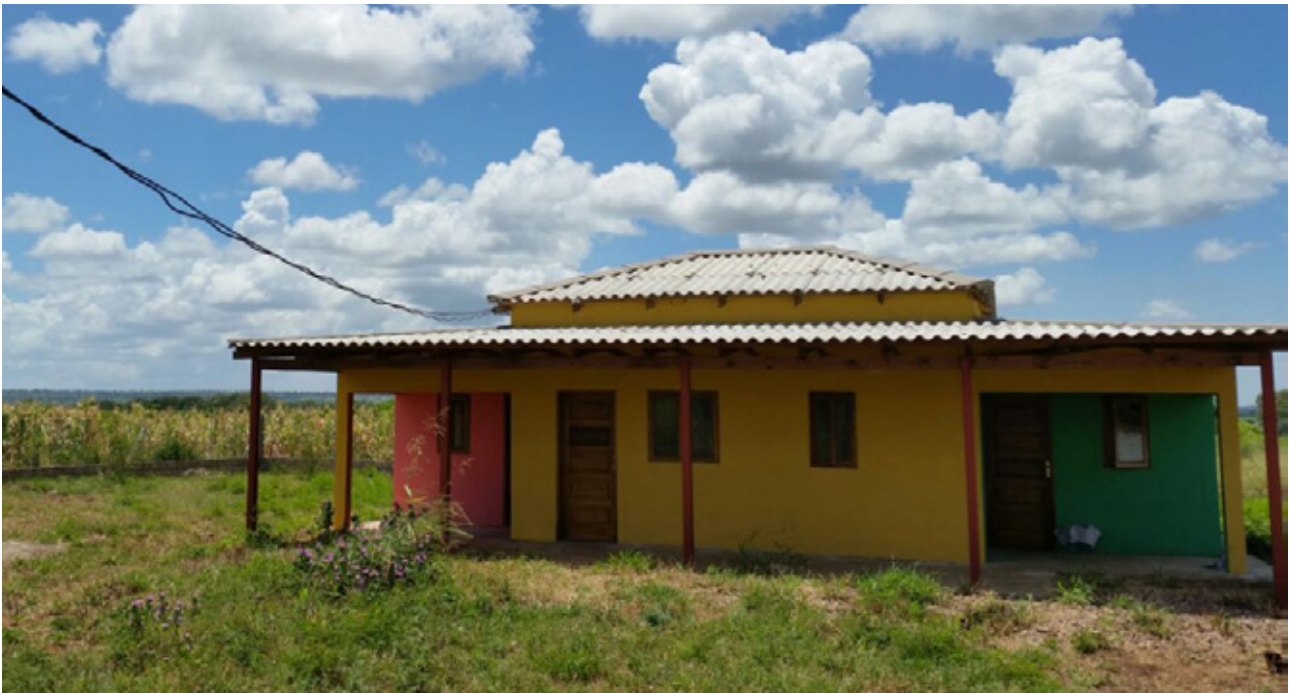
Casa Villa Glori prima dell'inaugurazione

I nostri “poveri”, i residenti di Villa Glori, hanno maturato la convinzione di essere sì poveri, ma con la “camicia”, per cui dovevano fare qualcosa, volevano restituire a questo mondo un po’ della loro fortuna.